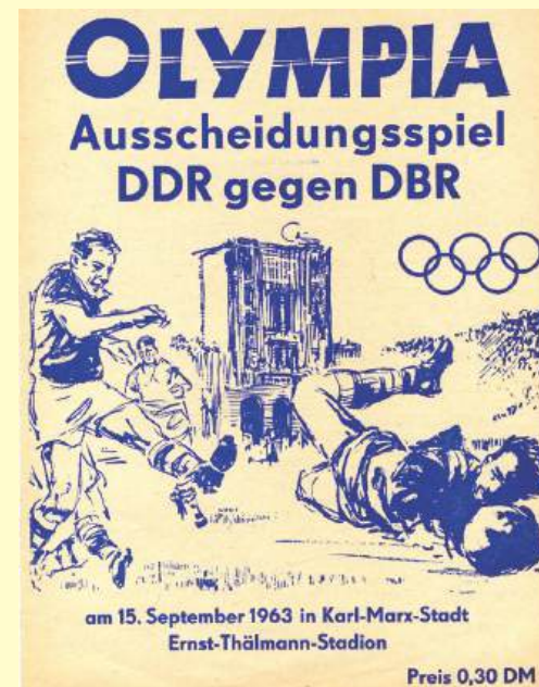
Programmheft zum Olympia-Qualifikationsspiel Karl-Marx-Stadt (Chemnitz) 1963.