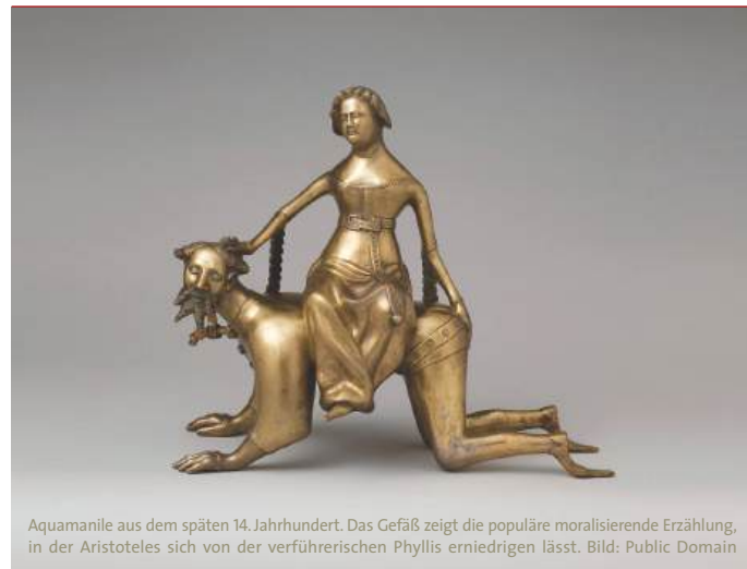
Aquamanile aus dem späten 14. Jahrhundert. Das Gefäß zeigt die populäre moralisierende Erzählung, in der Aristoteles sich von der verführerischen Phyllis erniedrigen lässt.

Öffentliche Führungen am 7. 7. und 14. 7., jeweils um 18 Uhr, Ausstellungsraum Anmeldung erforderlich: mika.denke@uni-hamburg.de.