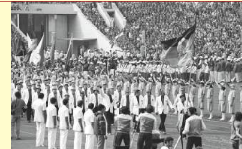
Einmarsch der DDR-Mannschaft in das Olympiastadion von Moskau 1980.