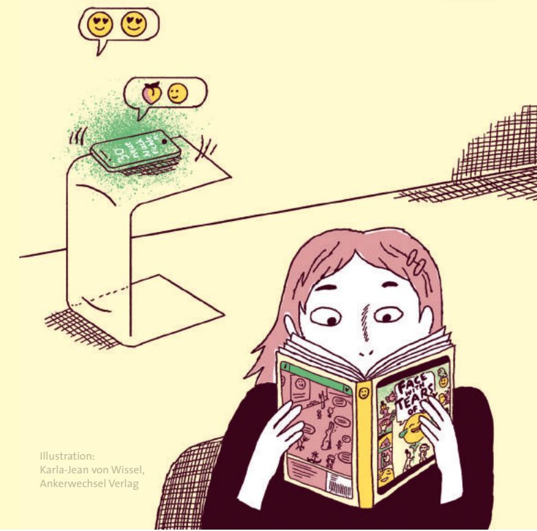
Illustration: Karla-Jean von Wissel, Ankerwechsel Verlag