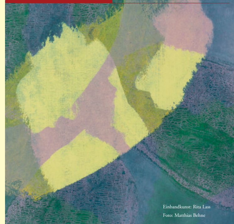
Einbandkunst: Rita Lass