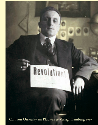
Carl von Ossietzky im Pfadweiser-Verlag, Hamburg 1919

Zum Internationalen Tag der Pressefreiheit lädt die Staats- und Universitätsbibliothek in Kooperation mit der Landeszentrale für politische Bildung zu einer Veranstaltung, die sich dem komplexen Thema Whistleblowing anhand eines prominenten historischen Beispiels nähert: Carl von Ossietzky, Hamburger, Journalist, Schriftsteller und Pazifist, deckte 1929 in der „Weltbühne“ die verbotene Aufrüstung der Reichswehr auf. Der anschließende „Weltbühne-Prozess“ sorgte international für Aufsehen und machte Ossietzky in nationalistischen Kreisen endgültig zum Feindbild. Am 4. Mai 1938 starb der Friedensnobelpreisträger des Jahres 1936 an den Folgen schwerer Misshandlungen durch die Nationalsozialisten. Die Stabi würdigt mit der Veranstaltung auch ihrem Namensgeber und ein Jubiläum: Seit exakt 40 Jahren ist die Bibliothek nach Carl von Ossietzky benannt.