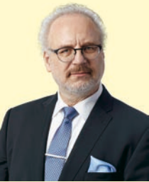
HAMBURG VIGONI FORUM

Aktuelle Informationen und Anmeldung zur Veranstaltung unter www.hamburg-vigoni.de .