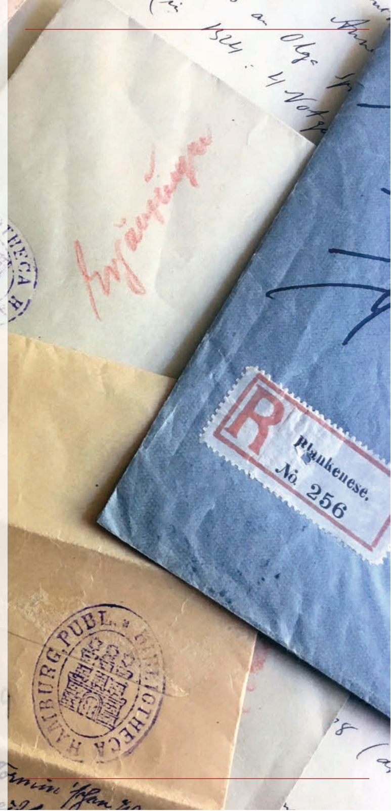
Grafik Design Philip Bartkowiak

Im Ausstellungsraum im Erdgeschoss. Geöffnet: Mo. – Fr. 9 – 24 Uhr, Sa. – So. 10 – 24 Uhr. Der Eintritt ist frei.